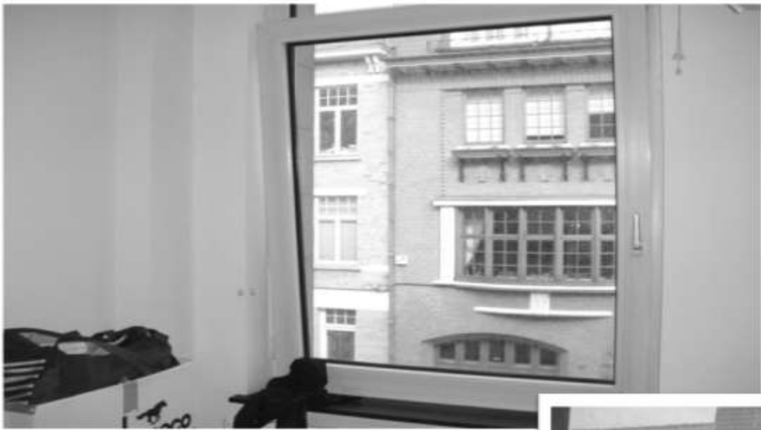
Fenêtre dans son contexte.