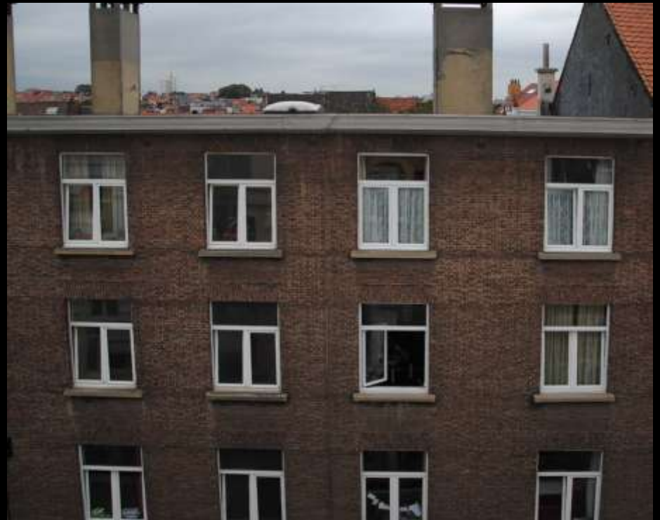
Rue cuve, n°34 Ixelles