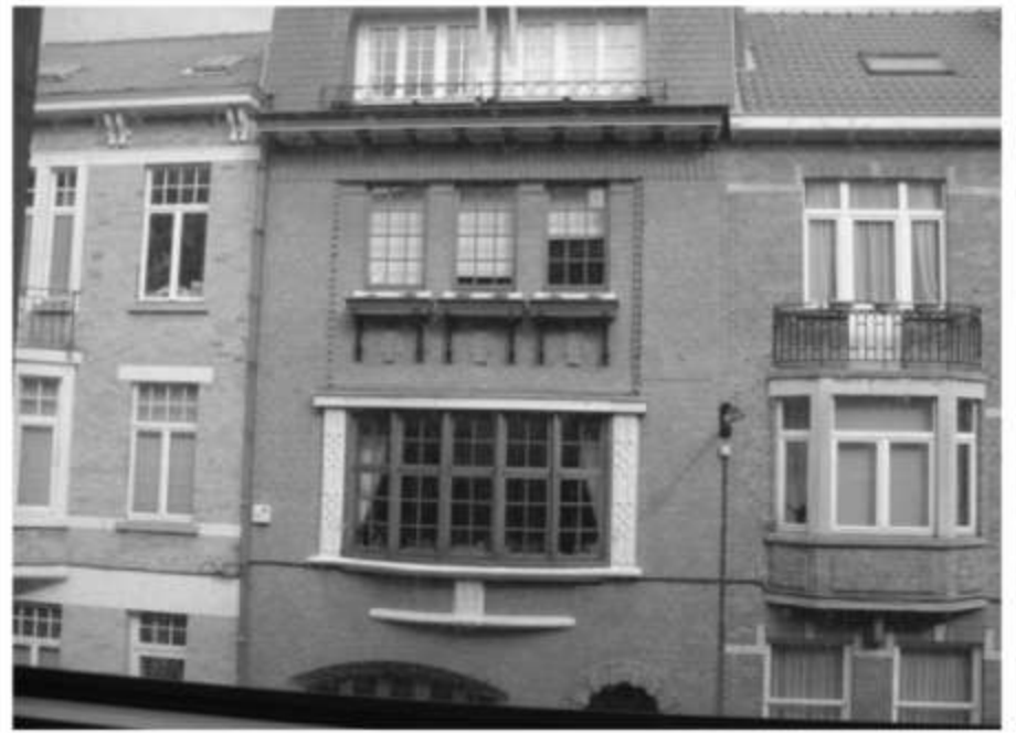
Vue frontale de la fenêtre.